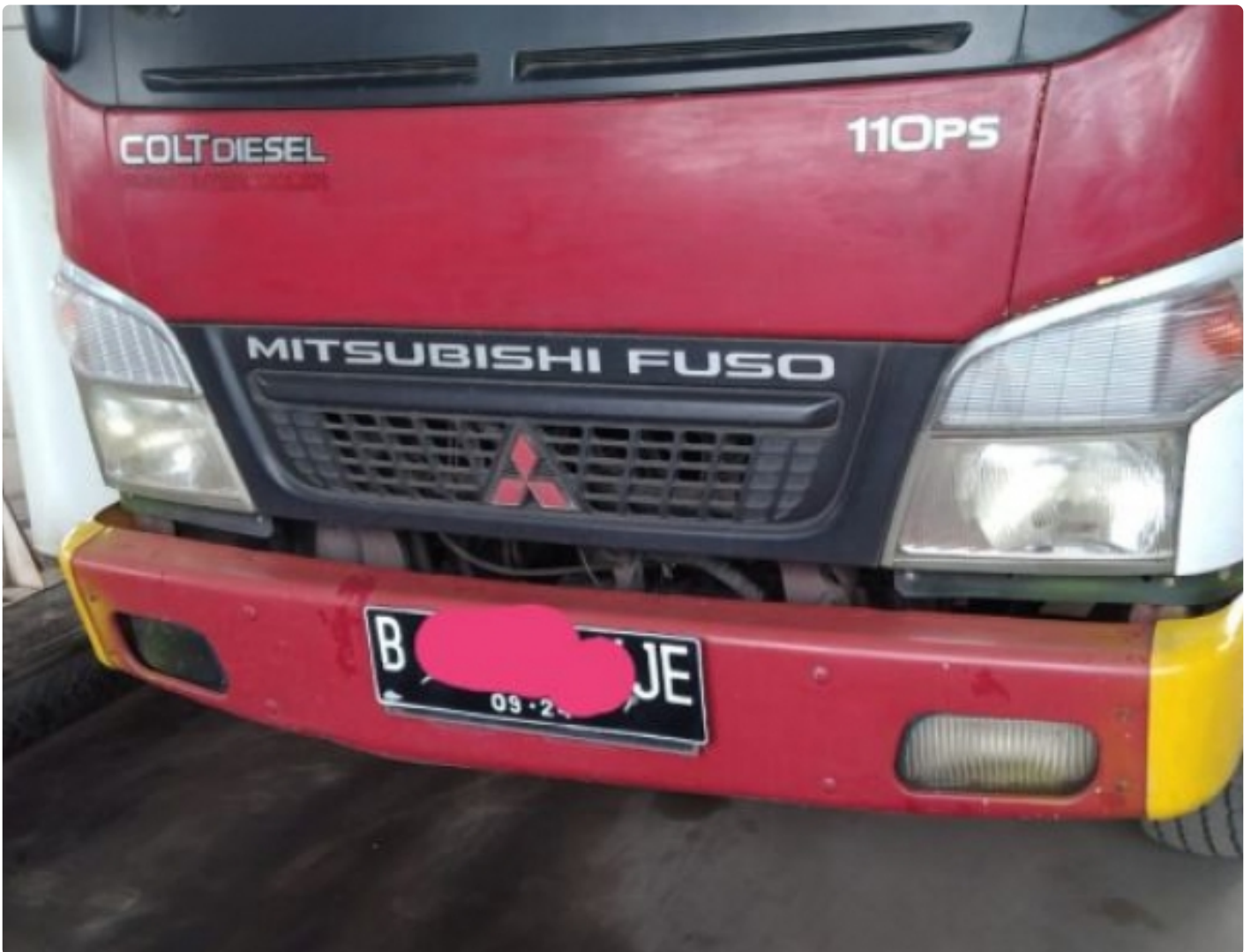
Mobil Box Engkel yang sudah dimodifikasi sedang melakukan pengisi bahan bakar solar subsidi di salah satu SPBU di wilayah Cileungsi (foto dokumen)

KAB.BOGOR,- Para mafia solar subsidi melenggang bebas melakukan usaha ilegal nya di wilayah pangkalan 9, 10 dan 12 Kec. Cileungsi Kab.Bogor. Dengan menggunakan mobil box engkel yang sudah dimodifikasi, para mafia ini membeli solar subsidi diluar kapasitas isi tangki normal.